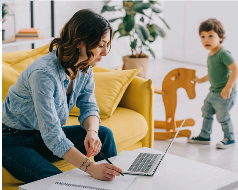
Im Homeoffice mit unter 12-Jährigen

von zu Hause aus arbeiten können, besteht dieser Anspruch nicht. Allgemein ist darauf hinzuweisen, dass der Arbeitgeber und der Arbeitnehmer während der aktuellen Krise Homeoffice anordnen kann, solange die Arbeit von zu Hause aus verrichtet werden kann. Wenn Sie von zu Hause aus arbeiten, sollte die Arbeitsschutzversicherung darüber informiert werden, anderenfalls es zu einem Versicherungsausfall kommen kann.