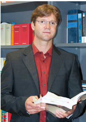
Anwaltskanzlei Dr. Rathenau & Kollegen www.anwalt-portugal.de