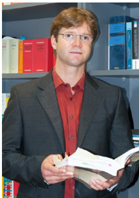
Anwaltskanzlei Dr. Rathenau & Kollegen www.anwalt-portugal.de