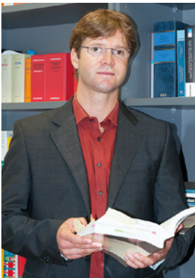
Anwaltskanzlei Dr. Rathenau & Kollegen www.anwalt-portugal.de

Stellen Sie sich vor, Sie befinden sich in Portugal mit einer anderen Person in einer Rechtsstreitigkeit, die Sache droht vor Gericht zu gehen, aber Sie können sich die Prozesskosten nicht leisten.