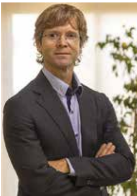
Anwaltskanzlei Dr. Rathenau & Kollegen anwalt-portugal.de